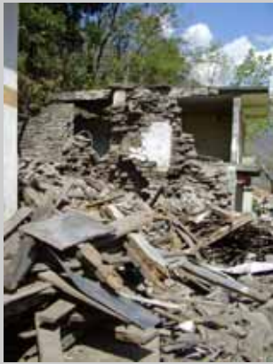
ダウリガンガ・ダム建設に伴うがけ崩れにより破壊された家屋

多国間開発銀行の政策改善： 日本が最大の出資国であるアジア開発銀行（ADB）の環境社会配慮政策の改善、そして世界銀行民間セクター融資部門の国際金融公社（IFC）の環境社会配慮政策・情報公開政策の改善のために、財務省スタッフや国際機関の日本理事、国際機関のスタッフなどへの提言活動を実施。提言書を発表しました。